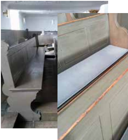
So ist es jetzt