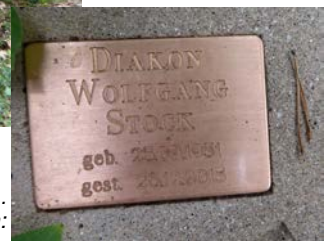
Eine kreisrunde Platte im Waldboden ... und eine Metalltafel mit den Lebensdaten: